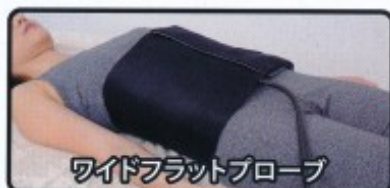
ワイドフラットブローブ